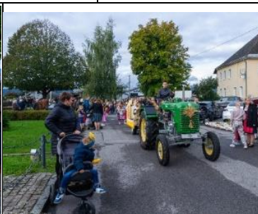
Der Festzug erreicht die Kirche