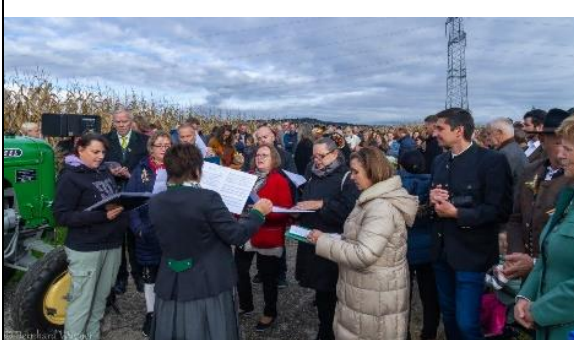
Kirchenchor Maria Rojach