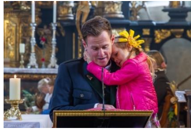
Ein junger Familienvater mit Töchterchen liest die Lesung