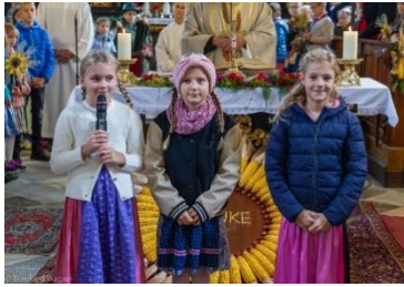
Kinder sprechen die Kyrie-Rufe