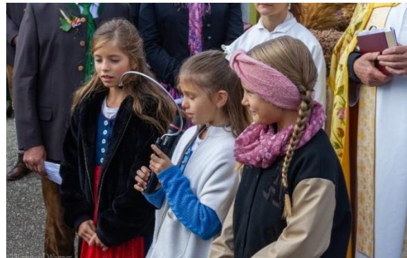
Kindergarten und Volksschule Maria Rojach beim Erntedank 2024 mit ihren schönen Beiträgen.