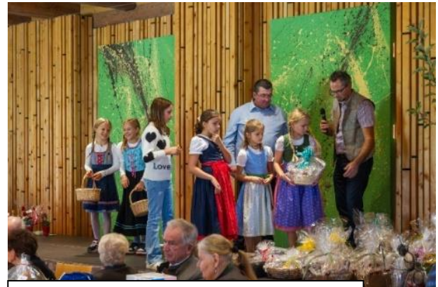
Glückshafen und Verteilung der Preise.