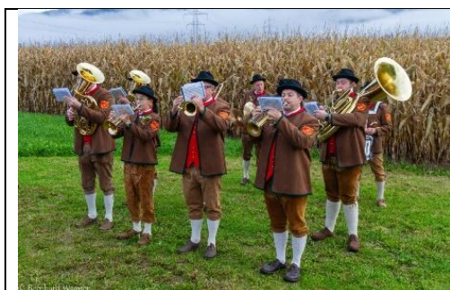
Blasmusik Maria Rojach