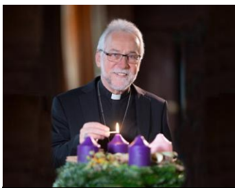
Bischof Marketz in Adventhirtenbrief: Glaubende sind Lichter der Hoffnung; Foto: Diözesan-Pressestelle KHfessl- Abbildung /