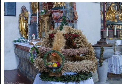
Erntekrone in der Kirche