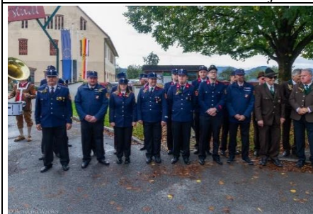
FF Maria Rojach u. Kameradschaftsbund