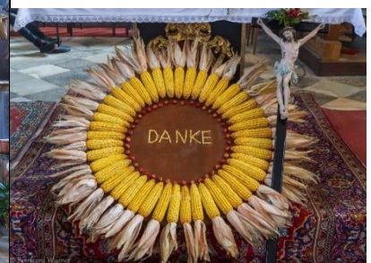
Ein Kunstwerk aus der Natur. Danke den fleißigen Frauen u. Männern!