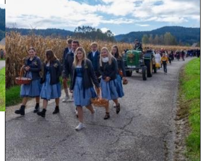
Landjugend Maria Rojach