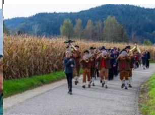
Festzug zur Kirche