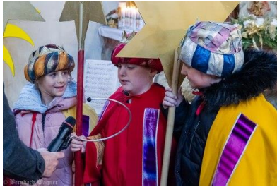
Sternsingen 2023/24 in Maria Rojach

Wir bitten um Ihre Spende zugunsten der Armen der Welt, 2025 für Nepal und ca. 500