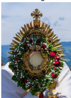
Monstranz der Pfarre Maria Rojach