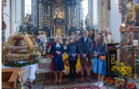
Vortragen der Fürbitten durch Vertreter der Ortschaften Unterpichling und Aich